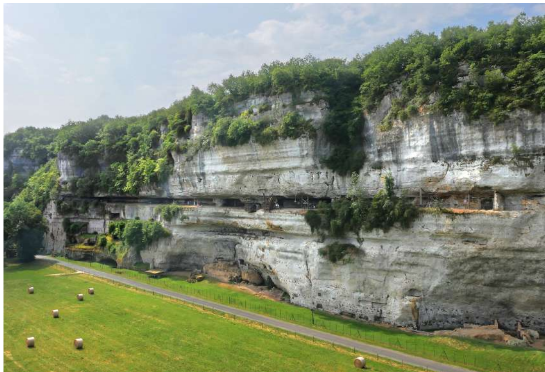
La Roque St Christophe

Les papeteries de Condat : Elles représentent près de 500 salariés et appartiennent au groupe Lecta. Lecta est une compagnie européenne leader dans la fabrication et la distribution de papiers spéciaux pour étiquettes et emballage souple, de papier couché et non couché pour l'édition et l'impression commerciale et d'autres produits à haute valeur ajoutée, comme sa nouvelle gamme innovante de papiers fonctionnels respectueux de l'environnement, totalement recyclables et biodégradables.