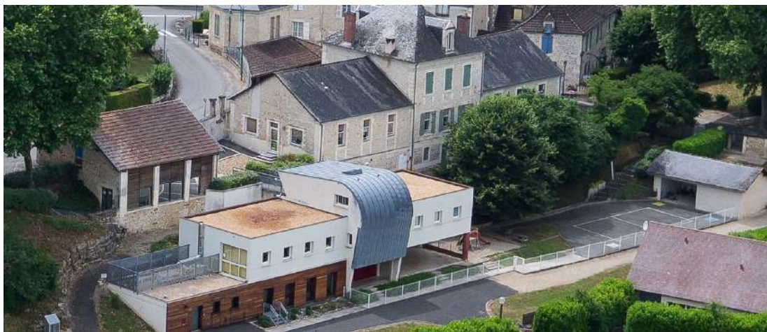
Ecole de La Bachellerie