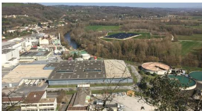
Les papeteries de Condat

Pépinière des métiers à 10 kms : Elle est installée au sein du carrefour économique. Cet espace de 3 000 m 2 simple et fonctionnel propose des boxes individuels, des espaces administratifs et des locaux (vestiaires) communs, ainsi qu'une salle de formation. Il s'agit de permettre à des artisans de s'installer dans des conditions adaptées. Cet ensemble, est dédié à la création et à la reprise d'entreprises artisanales.