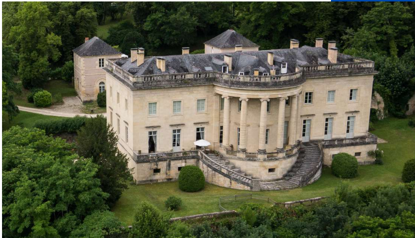
Château de Rastignac

Triste souvenir, aussi, fut ce 30 mars 1944 où les soldats de la division Brehmer incendièrent le château avant de fusiller 15 personnes dont 2 enfants. La gendarmerie fut, quant à elle, incendiée le 12 juin 1944.