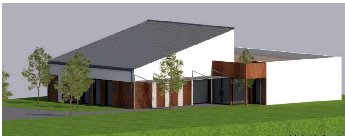
Maison médicale de La Bachellerie

- en zone d'intervention prioritaire (ZIP) permettant d'avoir des aides à l'installation pouvant aller jusqu'à 50000€ . Ces aides, proposées par les autorités de santé, se présentent sous diverses formes comme le Contrat d'Aide à l'Installation des Médecins (CAIM), le Contrat de Praticien Territorial en Médecine Générale (PTMG) ou encore le Contrat d'Engagement de Service Public (CESP).