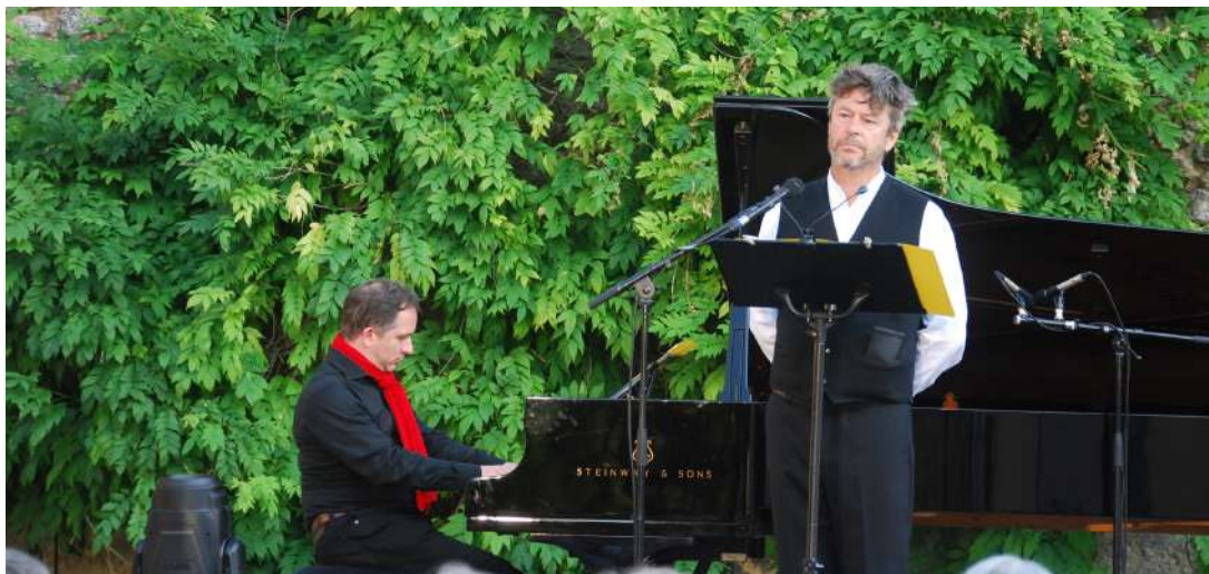
Festival du Périgord Noir

Dans un rayon de 30 minutes en voiture :