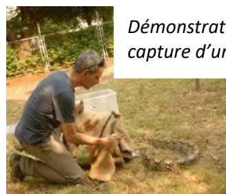
Démonstration de capture d'un serpent

Bonne fêtes de fin d'année à toutes et tous !