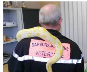
Le vétérinaire des pompiers en formation avec « Miel » notre python birman