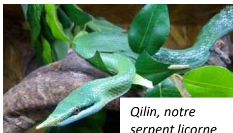
Qilin, notre serpent licorne